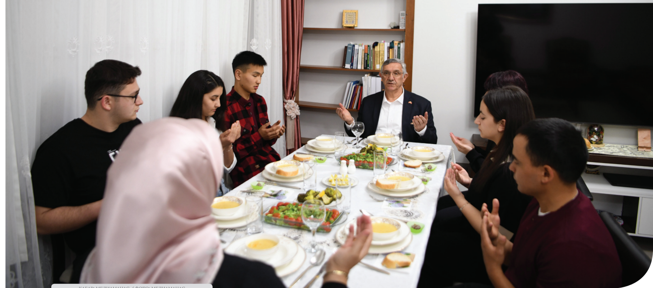
КАБАР: МЕДИАМАНАС